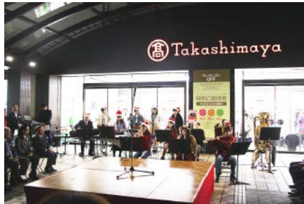
ホワイトスターズの演奏

11月15日(木) 毎年恒例の港南台光の街づくり実行委員会による「ウインターイルミネーション点灯式」が、港南台駅前高島屋港南台店の玄関前で行われました。本学学生で結成されたホワイトスターズの演奏と附属幼稚園の子どもたちの可愛い歌声が花をそえ、会場に集まった皆さんと一緒に10のカウントダウンで、港南台駅前が色とりどりにライトアップされました。2019年2月14日までライトアップされています。